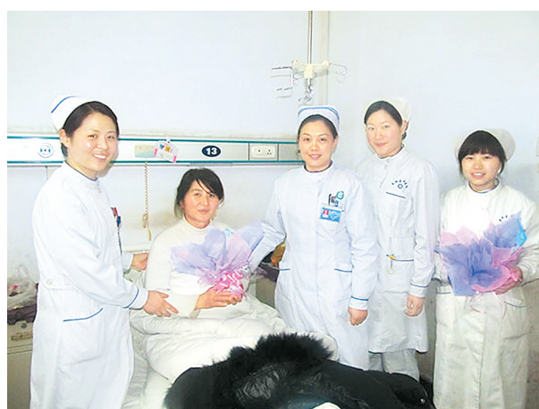
节日里，该院医务工作者自发为患者送去“平安”祝福，让他们感受到来自医院的温暖。