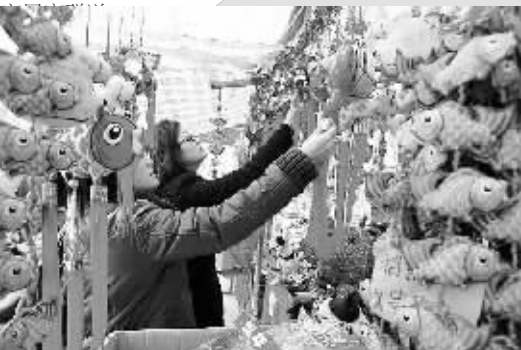
▲香港年货市场传统年味重。

记者2月1日河南省文化厅获悉，春节的活动以庙会为题材，“打响庙会歌”，形成全省庙会大联动。