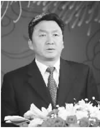
商丘市委副书记、市长王保存

同志们、朋友们： 爆竹声声辞旧岁，欢欢喜喜迎新年！在这普天同庆、万家团圆的美好时刻，我代表中共商丘市委、商丘市人民政府，向全市广大工人、农民、知识分子和各级干部，向各民主党派、工商联、无党派人士和社会团体，向驻商解放军指战员、武警消防官兵和公安民警，向离退休老同志、军队转业复员军人，致以节日的祝福！向所有关心、支持和参与商丘建设的社会各界人士致以诚挚的感谢！向节日期间坚守岗位、工作岗位上同志们、朋友们致以亲切的问候！