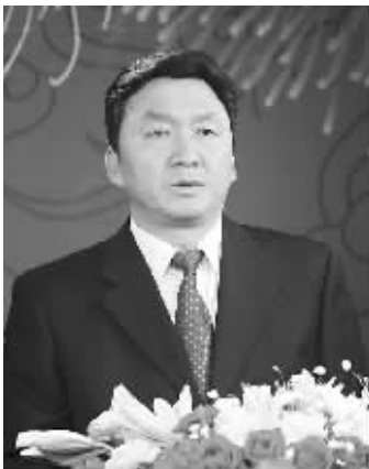
商丘市委副书记、市长王保存