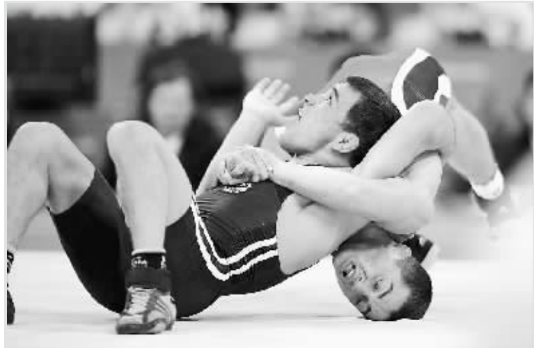
① 12 日，在男子古典式摔跤 55 公斤级决赛中，俄罗斯选手纳济里·曼基耶夫(左)战胜阿塞拜疆选手罗夫尚·巴伊拉莫夫夺冠。

新华社北京 8 月 12 日电 北京奥运会男子水球比赛 12 日进入小组第二轮。在与德国队的比赛中，中国队在领先的情况下被对手反超，遗憾地以 5:6 落败。