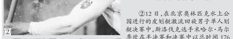
② 12 日，在北京奥林匹克水上公园进行的皮划艇激流回旋男子单人划艇决赛中，斯洛伐克选手米哈尔·马尔季坎在半决赛和决赛中均以总时间 176 秒 65 的成绩获得冠军。