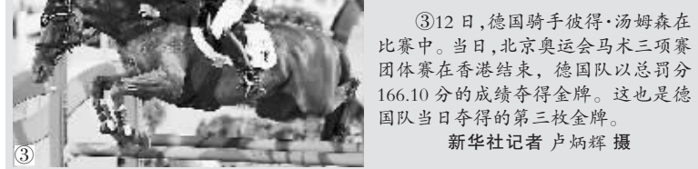
③ 12 日，德国骑手彼得·汤姆森在比赛中。当日，北京奥运会马术三项赛团体赛在香港结束，德国队以总罚分 166.10 分的成绩夺得金牌。这也是德国队当日夺得的第三枚金牌。