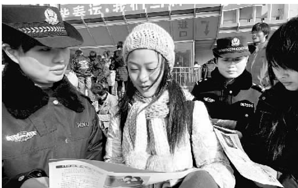
梁园公安分局民警在商丘火车站广场给过往乘客讲解如何防盗。