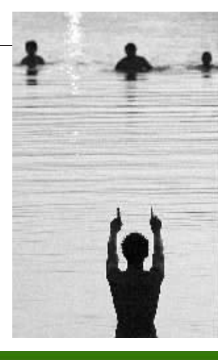
文/晚报记者 翟华伟 图/晚报首席记者 魏文慧