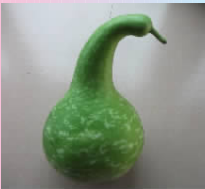
再后来他们长大了变成了一个葫芦……