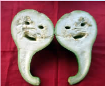
随着时间的推移，他们终于有了爱情的结晶，生了一对双胞胎葫芦娃。