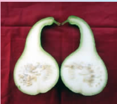
终于他找到了另一半，瞧，他们真心相爱了！