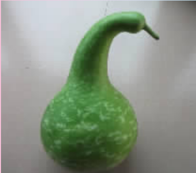
这个身穿绿色外衣的葫芦一直在默默的等待，希望找到心目中的另一半。