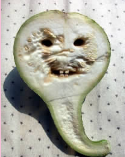
双胞胎葫芦娃哥俩一天天在长大，这是哥哥扎牙时的照片，简直太可爱了。