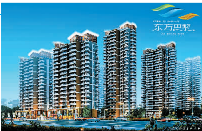
东方巴黎楼体效果图

东方巴黎位于城市东西主干道——南京路东段，紧挨火车南站。项目开发商为河南国赫置业有限公司，占地面积50亩，建筑面积12万平方米，由1栋16层、2栋17层、6栋26层瞰景高层组成，全部框架剪力墙结构，抗震、抗拉、抗冲击，一体化性能良好。商丘市唯一一家流线型阳台、流线型外立面设计，多维度拓展人与自然的互动空间，不仅仅赋予小区及建筑的动感，更彰显现代建筑艺术风格的时尚和典雅，尽显商丘“巴黎范儿”。