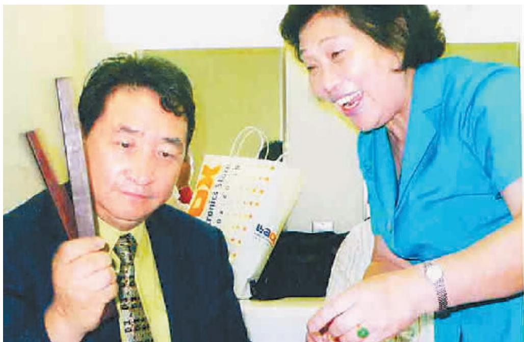
宋爱华教中国曲艺家协会主席、著名相声表演艺术家姜昆打筒板