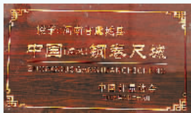
虞城获得“中国钢卷尺城”称号