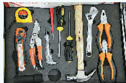
让产品走进寻常百姓家——多功能工具包

过拉长产业链条,促进产业转型升级,目前五金机电产业集群已从单纯的钢卷尺加工转向了钢卷尺、五金工具、电动工具、气动工具、高端电子产品、机电产品、交通运输装备的生产、加工、销售,产业层次、产业规模得到大幅提升。目前,已新上电动气动工具生产项目2个(家铭电动工具、伊美电动工具)、电动三轮车、四轮车、新能源电动汽车项目5个(步步先科技、白天鹅车业、玲珑玛电动车、中杰新能源电动轿车、七星豹电动汽车)、特种车辆制造项目2个(通达专用车辆制造、悦亚特种车辆制造)。