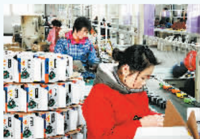
工人们正在认真组装出口产品