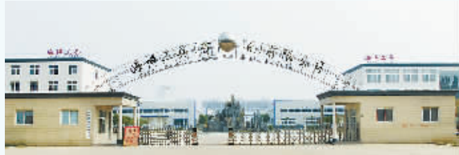
海博工具企业外景