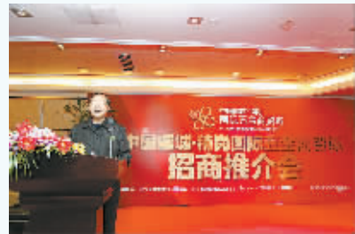
虞城县委书记何振领在中国虞城稍岗五金商贸城招商会上介绍五金发展情况

亿只(套)、钢带10万吨、电子产品6000万只、电动三轮四轮车30万辆、特种车辆3万辆等的生产能力。虞城县已成为全国最大的钢卷尺加工基地,占全国钢卷尺产销份额的85%以上,出口份额占全国近50%。2013年完成工业产值65亿元,2014年1-9月份完成工业产值69亿元,五金机电及配套类企业从业人员达到2.3万人。