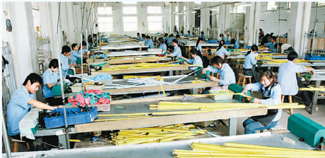
产业集聚区的钢卷尺生产车间