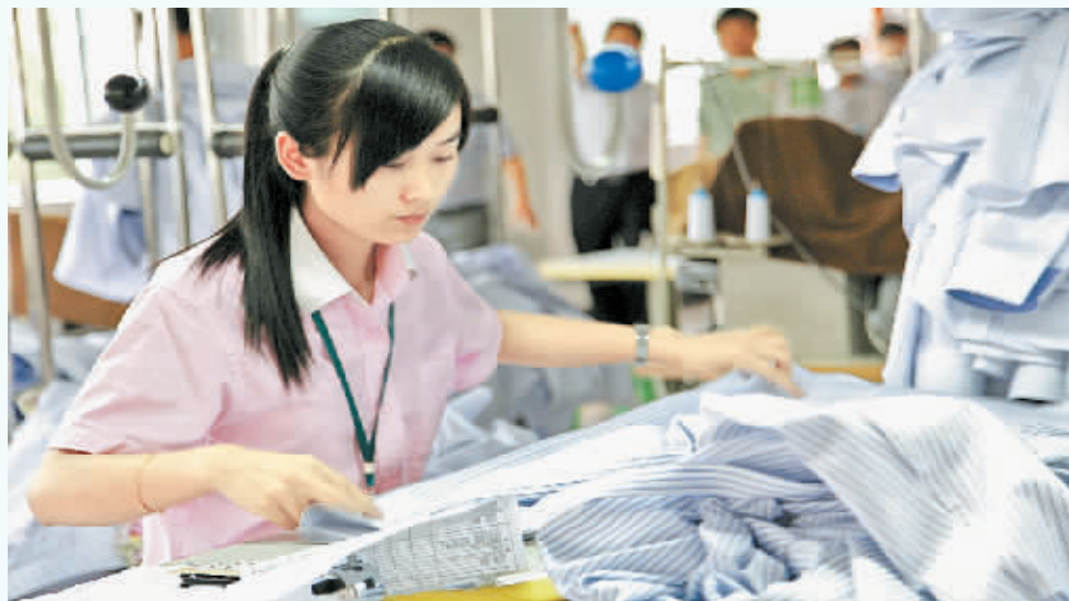
乔治白服饰生产车间

行数字化处理,系统能够发现2米长纱线内的云斑疵点。目前,国内纺纱企业拥有这种设备的不超过5家,台数不超过30台,仅汇丰就占有18台。辰龙纺织也从德国、瑞士等国家引进先进的纺纱设备,生产效率成倍增加,产品残次率明显降低。服装行业通过引进乔治白、顶森等国内知名企业,不断引领服装加工向品牌化、规模化、外向型发展。