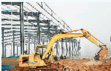
食品企业新上项目