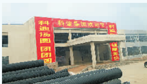
科迪80万吨液态奶项目