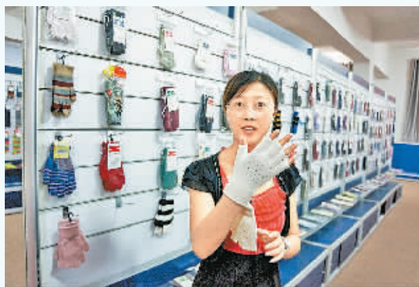
中国手套城：中国手套城的一位工作人员在展示产品。中国手套城由宁波富田集团、中国产业集群研究院和中国手套协会三方携手打造，总投资达 45 亿元，项目规划建设产业园、物流园、商贸城、国际手套大厦等，规划 5 年内分步实施完成。