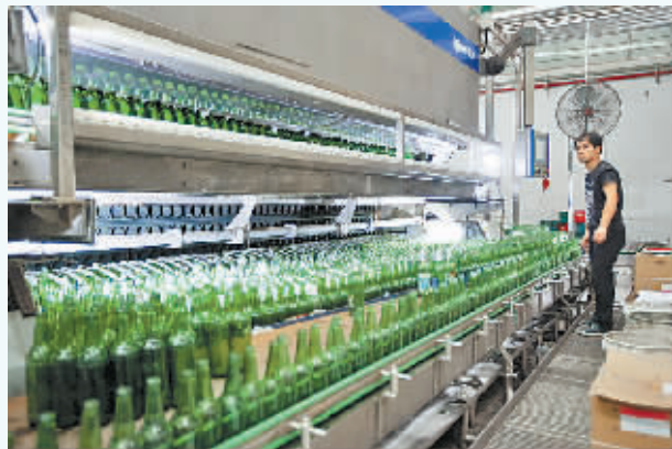
项目总投资5.16亿元，总体规划年产啤酒26万千升的华润雪花啤酒（商丘）有限公司。