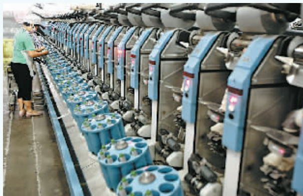
河南商丘银河棉业集团已形成50万锭纺纱生产能力。

为努力实现招商转型，睢阳区还牢牢把握商丘市“政治文化中心”这一独特区位优势，在加快推进业态改造中，切实做好商贸、旅游及商务酒店、写字楼等三产项目的引进招商。今年，比如瑞华维景国际、信华大酒店、宇鑫国际等一批酒店、写字楼先后落成。同时，像中投集团投资的万亩农业观光等一批农村休闲观光旅游招商项目陆续启动。