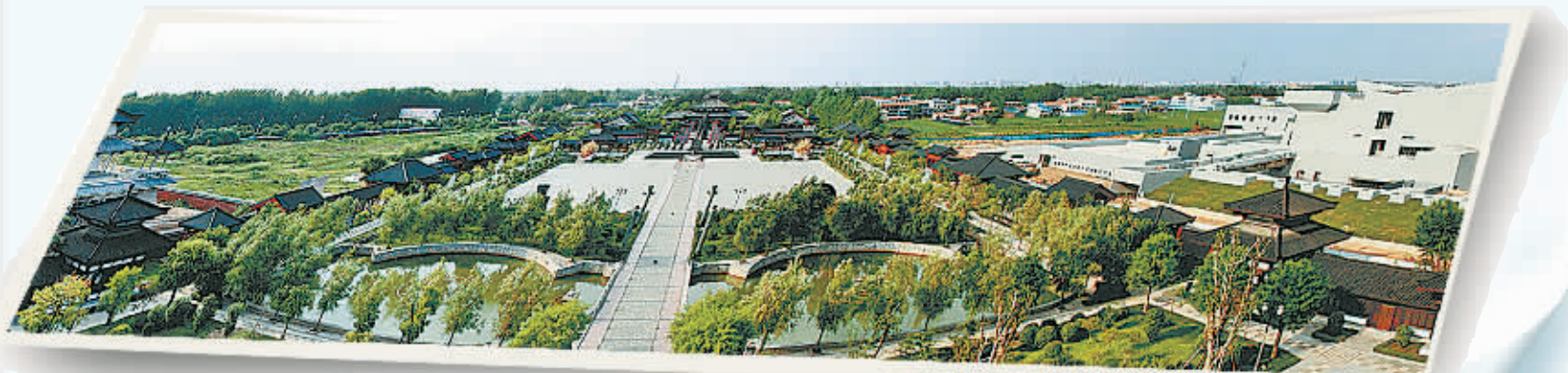
气势恢宏的华商文化主题公园景区，在这里已连续举办四届国际华商节，“三商之源”、“华商之都”的商丘品牌越来越响。