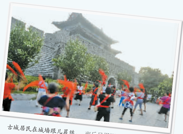
古城居民在城墙跟儿晨练。