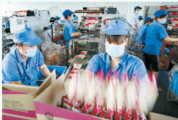
阿凡提食品：阿凡提食品的员工将刚生产出的方便面装箱。河南阿凡提食品股份有限公司是一家以清真方便食品为主业，集生产、销售、研发于一体的现代化综合食品企业。目前，该公司有方便面、面粉、膨化食品、饮料四大系列 40 多个品种的产品，产品市场覆盖全国 60% 以上的省(市、自治区)。