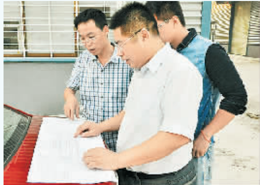
电子电气产业园首席服务官在和技术人员谋划建设方案。

据悉，产业园区以恒生电子为龙头，以中航电子集团为技术支撑，以高新技术产品为主导的企业11家。主要生产智能芯片、电子器件、LED太阳能及高端电力产品和电力检测、民用电器、工用电器、智能保健医疗电子产品等六大类400多种。有专利技术117余项，成果16项，国内知名产品11种。最大的特点是产业结构向高、新、特发展的引领，发展壮大了梁园区电子电气产业。也是我市规模最大、高新技术凸显、发展前景最好的科技园区。