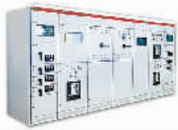
GCK(D)抽出式低压开关柜柜架

河南中电电力科技有限公司是专业从事高低压成套电器、电线电缆、仪器仪表生产销售及技术研发、推广服务的科技公司。拥有剪板机、数控折弯机、台式摇钻、叉车、行车、高精度电子实验仪器、自动成套电器装配线、检验台、运输配送系统及包装设备等。正在新建高低压电器智能成套设备、输变电设备、电力自动化和工控设备生产线。有明确的市场需求和较强的市场竞争力，有较好的社会效益和经济效益，市场前景非常广阔。