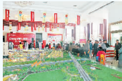
白云世贸商城销售展览大厅一角。