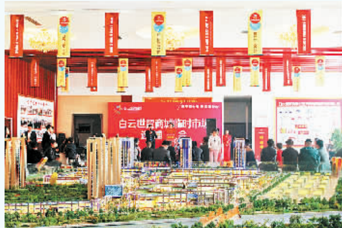
人潮涌动的白云世贸商城选铺会现场。