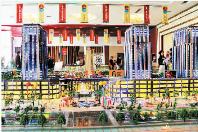
美轮美奂的白云世贸商城综合效果图。