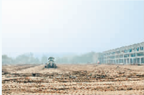
正在建设的临时市场商铺工地。