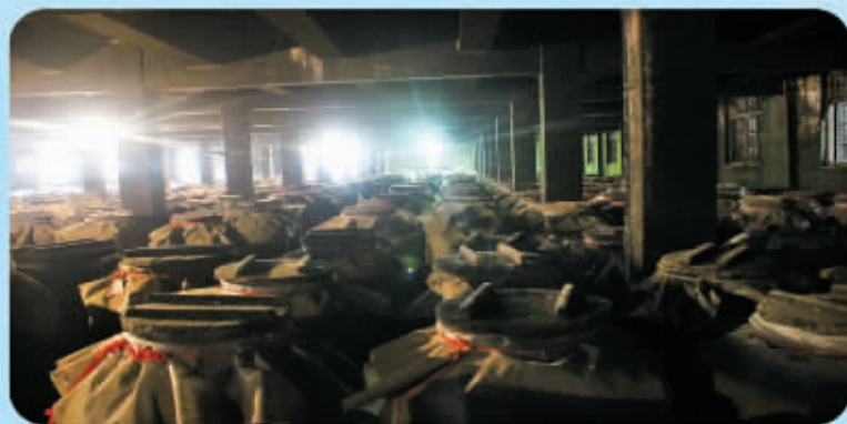
窖藏数十年的林河原酒

2013 年 12 月 12 日，“林河杯”桥牌邀请赛在北京人民大会堂隆重举行。中共第十五届中央政治局常委、国务院原副总理李岚清，第九、十届全国人大常委会副委员长成思危，第十一届全国人大常委会副委员长陈至立，财政部原部长项怀诚，中国科协原党组书记邓楠等出席邀请赛，预示着林河酒业品牌形象宣传全国化战略拉开序幕。