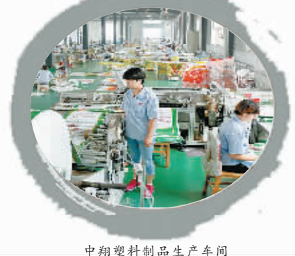
中翔塑料制品生产车间