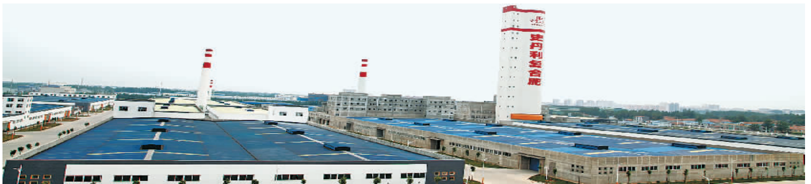
史丹利化肥宁陵有限公司厂区图