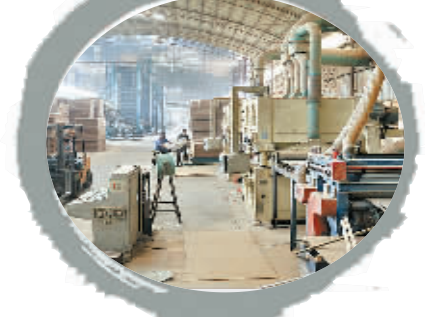
宇森木业生产车间