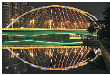
长江路一号桥夜景