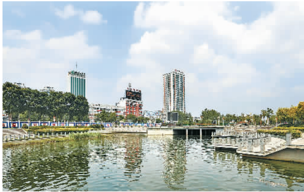
清清的运河水倒映着蓝天白云、高楼大厦,运河两岸成为市民休闲的好去处