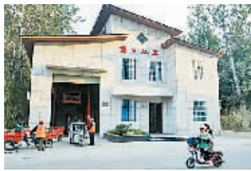
改建后的公厕和垃圾中转站

为从源头上减少矛盾,我市还完善了矛盾排查化解机制,充分发挥“红白理事会”、“村民理财小组”等群众性自治组织作用,构建了有地方说理、有人评理、有办法处理的工作新格局。