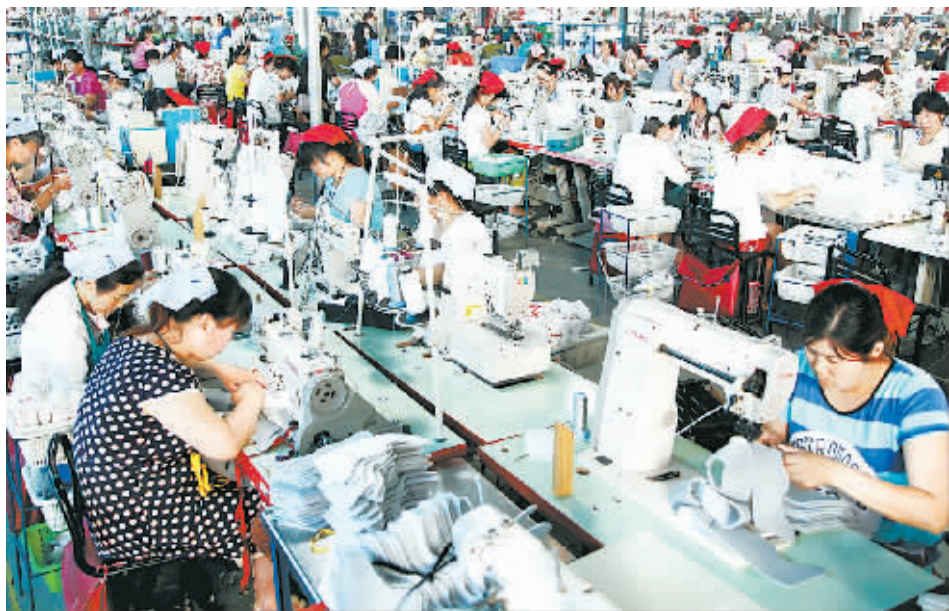
安踏集团河南嘉鸿鞋业加工项目。该项目总投资7.8亿元,其中固定资产投资5亿元,总占地规模650亩,主要从事运动鞋的生产与经营。

广州万宝集团在民权投资兴建的制冷工业园项目总投资20亿元,具备年产冰箱、冷柜300万台、制冷压缩机600万台、冷藏车专用机组2万台的生产能力。