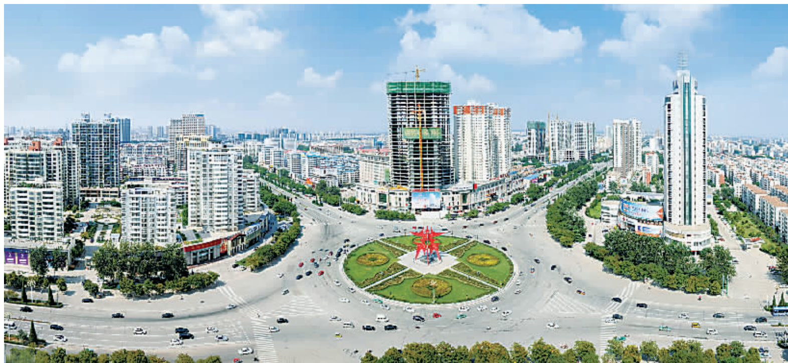
商丘城市发展日新月异