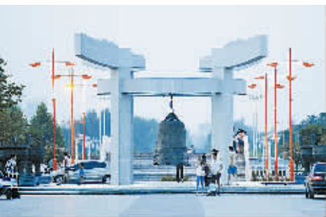
市民们在应天公园游玩