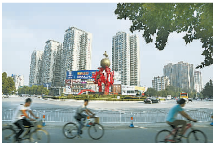
清除了“城市蜘蛛网”城市上空越来越敞亮