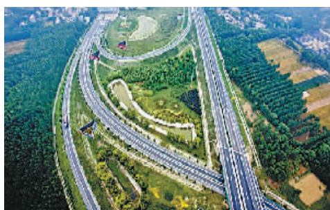
商丘高速公路四通八达