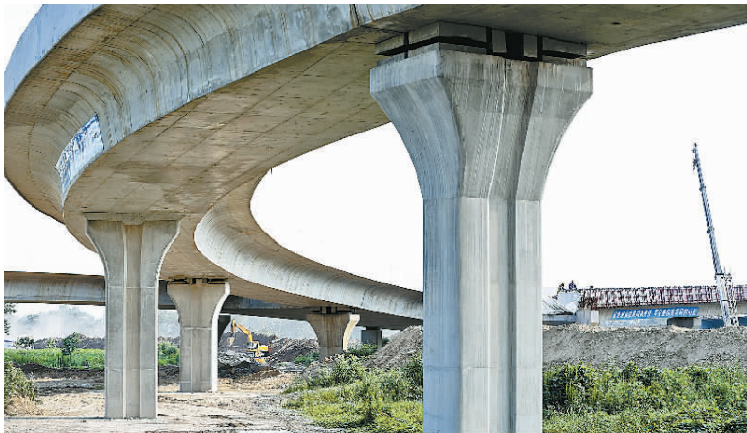
建设中的310国道与105国道交会处的立交桥