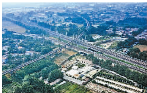
陇海铁路与京九铁路交会处