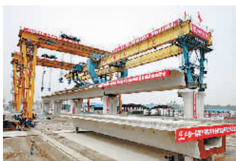
郑徐高铁首孔箱梁架设

2013年,我市郑徐高铁建设商丘段正式启动,预计2015年7月建成试运行。郑徐客运专线又名郑徐高铁,是《国家中长期铁路网规划》中“四纵四横”之一的徐州至兰州铁路客运专线的重要组成部分;是国家“十二五”综合交通体系规划中的区际交通网络重点工程。