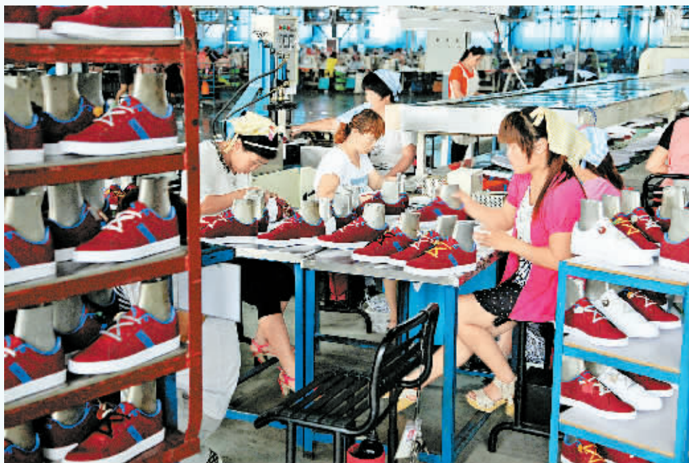
安踏鞋业：女工们在制鞋流水线上认真工作。安踏鞋业项目由安踏体育集团和广硕集团共同投资建设，主要从事运动鞋的生产与经营。项目全部建成投产后，年产值可达8亿元，可安排1.5万人就业，年创税收8000万元。

2010年9月份，富士康郑州科技园项目奠基，顺应富士康布局河南发展的难得机遇，睢县决定借势而动，顺势而为，搭上富士康这趟快速列车。市委、市政府高度关注睢县产业的发展，主要领导亲自过问、拜访，以真心、诚心、恒心感动了富士康的高层，富士康（睢县）实训基地正式落地睢县产业集聚区，不久富士康（睢县）实训工厂也开工兴建，二者造就了如今的富士康（睢县）