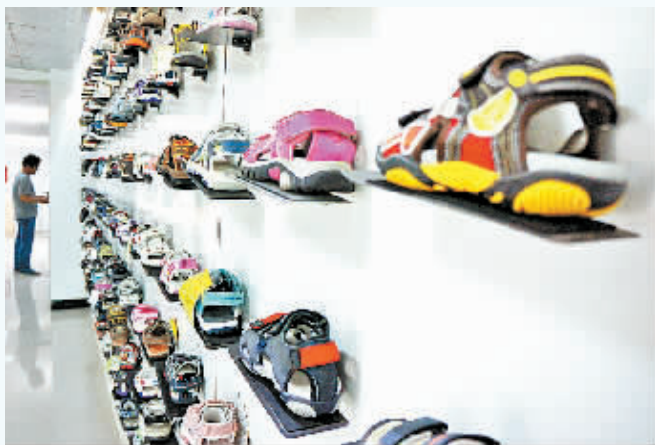
华莹鞋业：样式新颖、款式多样的运动式凉鞋整齐地摆放在展示柜上。河南华莹鞋业加工项目由福建晋江市华莹鞋业有限公司投资兴建，总投资3.5亿元，年加工运动鞋、休闲鞋、沙滩鞋300万双，实现利税1500万元。