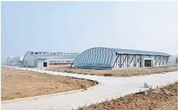
安踏二期嘉晋鞋业生产车间建设工地