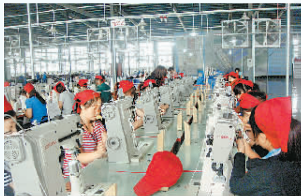
睢县安踏(嘉鸿)鞋业工人认真操作,实现了家门口就业转移

嘉晋鞋业项目布局中原、落户睢县,既是广硕集团优化战略布局、做大做强企业做出的重大决策,也是对睢县发展前景、人力资源、投资环境等优势充分肯定。该公司全部投产后,可安排就业2万余人,年产值12亿元,年税收1.2亿元。