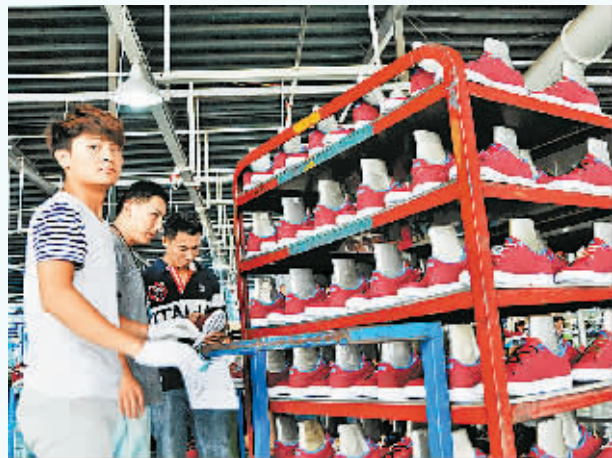
安踏鞋业又一批新款运动休闲鞋面世