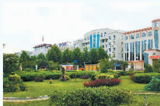
行政区域景观绿化