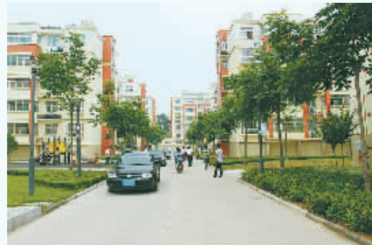
天湖城商住区环境绿化