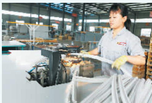
公司员工在认真作业。