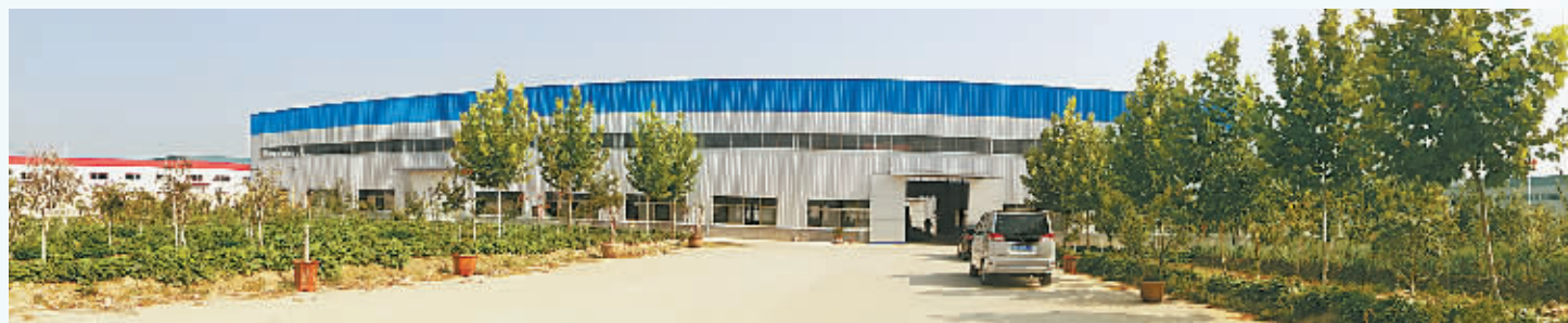
盛宝公司花园式厂区一角。