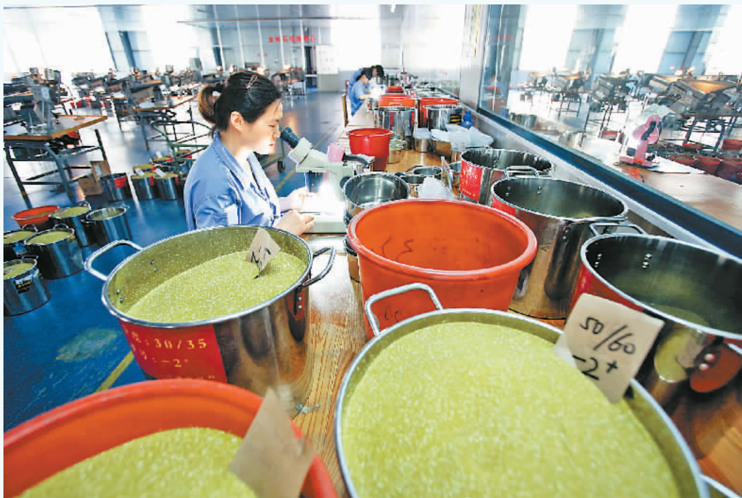
员工在金刚石分选车间工作。力量新材料集团是柘城县金刚石制品高新技术产业的龙头企业，年产金刚石10亿克拉，生产各种金刚石制品200万件。