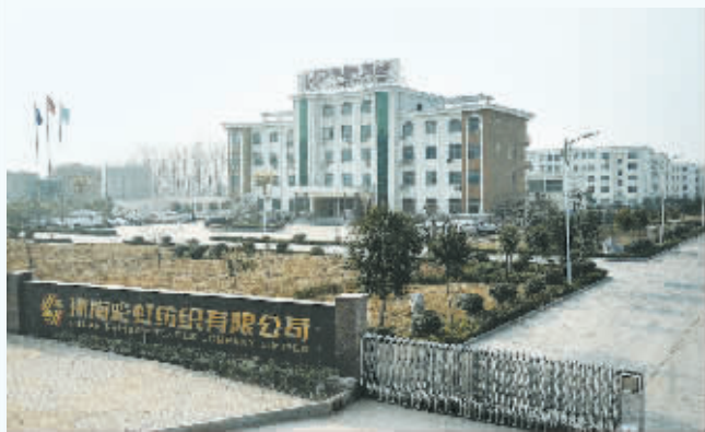
华鹏集团办公大楼