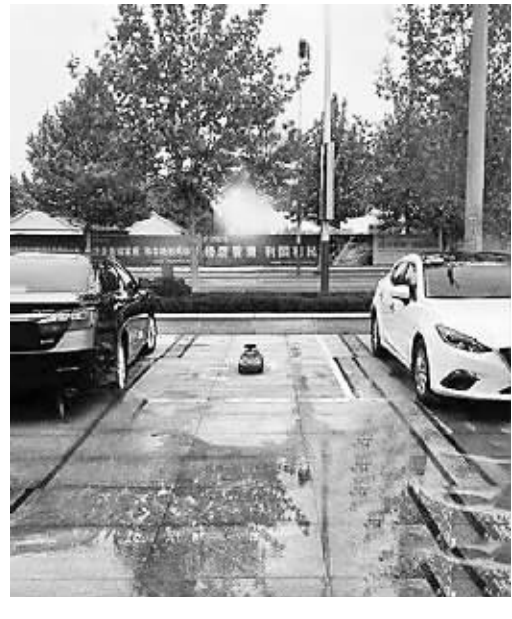
买了个车位不能空着