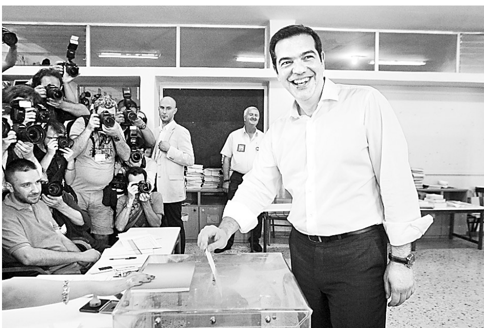
7月5日，在希腊雅典，希腊总理齐普拉斯在一家投票站投票

希腊总理齐普拉斯说，希腊人将在全民公决中决定是接受债权人提出的严厉而又无法实施的新紧缩和改革方案，还是努力寻求对希腊来说条件更好的协议，以便让希腊获得新的救助而留在欧元区。齐普拉斯政府呼吁选民们在投票中否