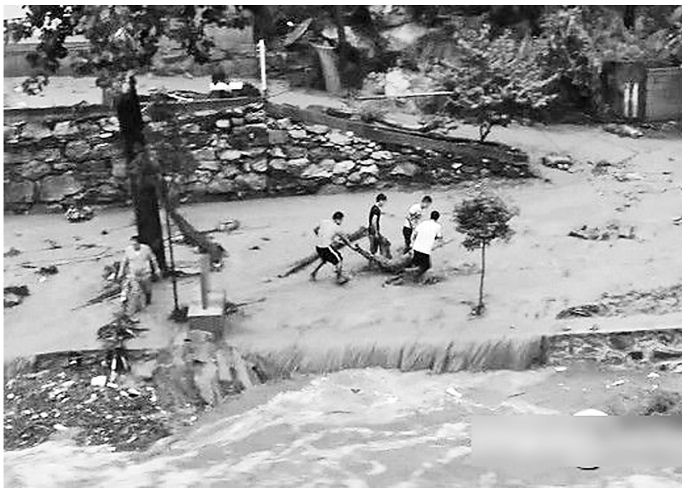
事故现场

员到达现场后首先沿着河道搜救被冲走的群众。同时，在山上还有多人被困，但是道路已经被洪水冲断。消防队员随后用木头搭建简易浮桥，设置临