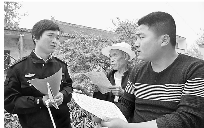
为进一步提高群众安全防范意识，近日，睢县公安局组织民警利用周末时间，深入辖区向群众讲解电信诈骗的手段特点，提醒群众不要泄露手机、银行帐户等个人基本信息。图为4月26日，周堂派出所民警向群众发放宣传单，讲解防范诈骗常识。

视海空情况，并根据需要采取一切必要措施。 吴谦强调，美国军舰来得再多再频，也改变不了南海诸岛及其附近海域属于中国的事实，也阻挡不了中国不断走向发展壮大的脚步，也更加动摇不了中国人民解放军坚定捍卫国家主权安全的决心和意志。据新华社