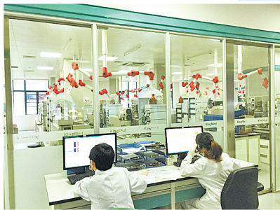
参观金域检验中心