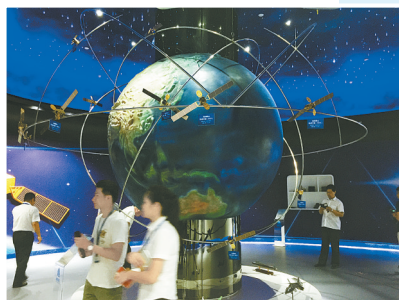
走进海格北斗产业园