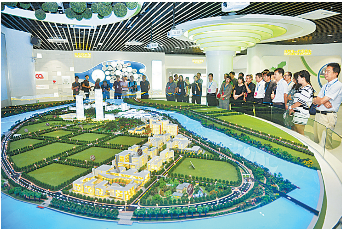
考察生物经济曼哈顿