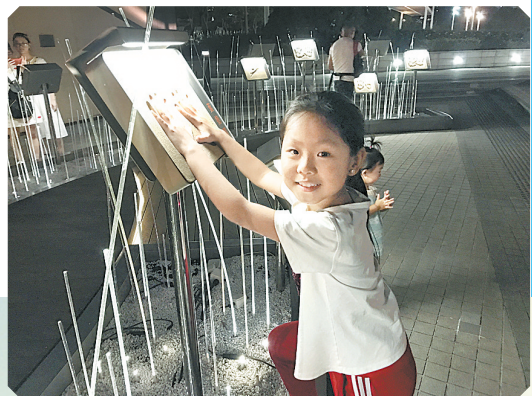
星光大道上的明星手印