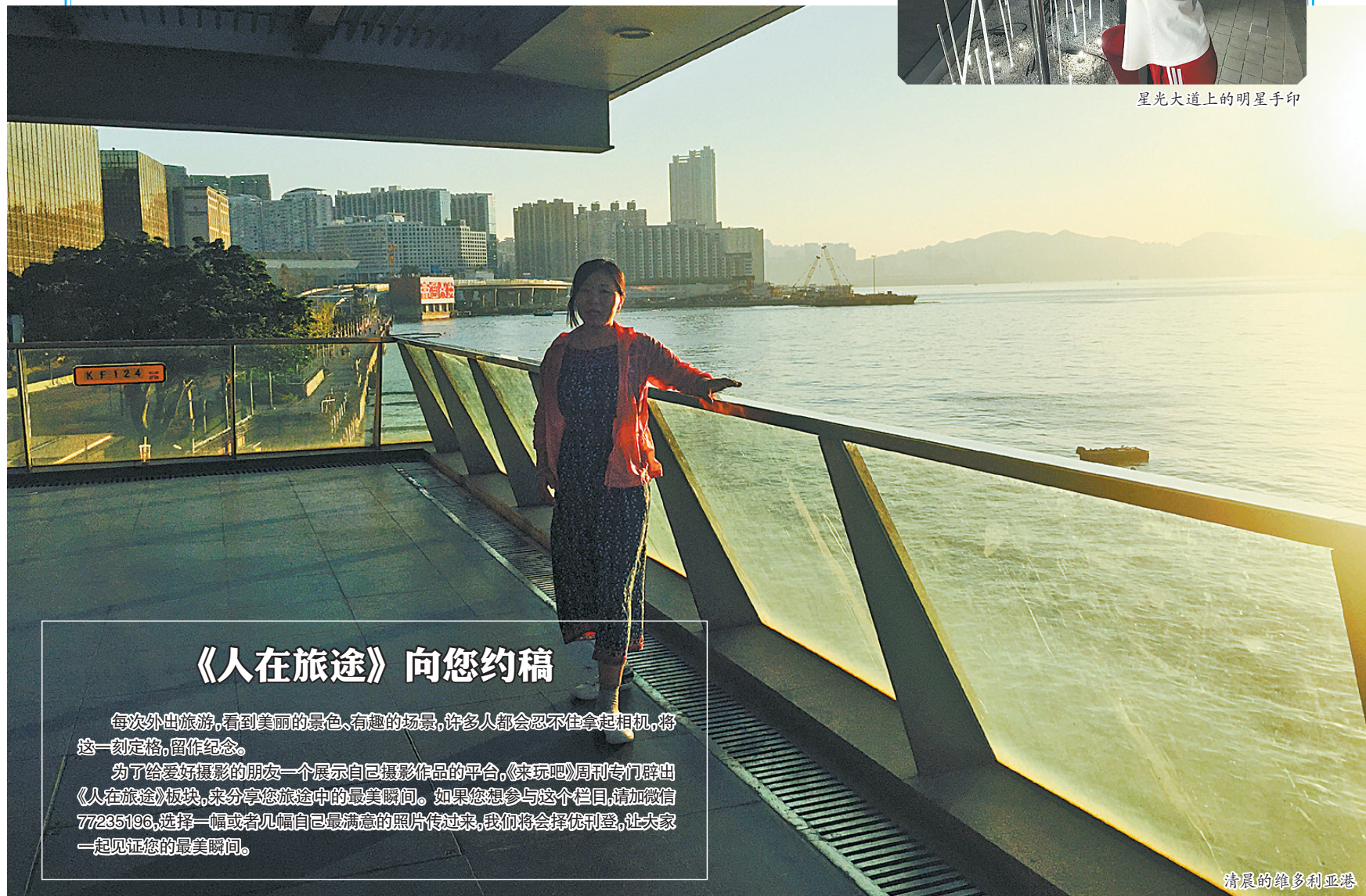
清晨的维多利亚港