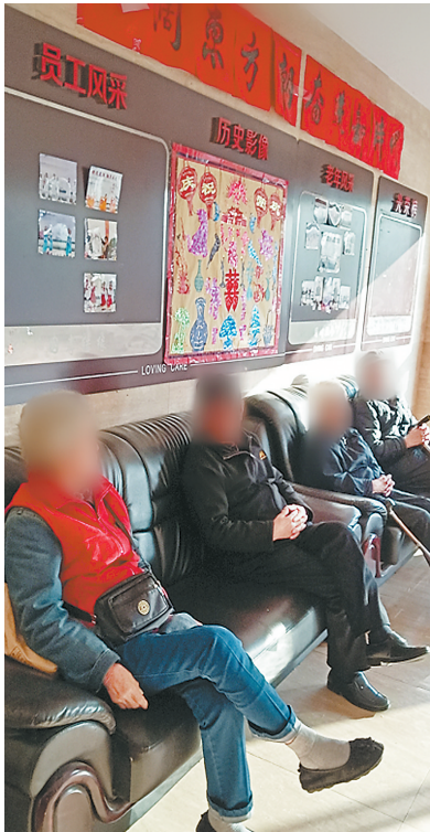
长沙一养老公寓里的老人

阅读提示: 条件、环境都不错的老年公寓,办理会员并交纳数额不等的入住预订金,就能享受优先优惠入住,还能领取高额回报。真实情况到底是什么?近年来,非法集资、网络传销等涉众型犯罪高发频发,新增风险陆续显现,一些标榜“高额回报、快速致富”等养老领域投资项目的骗局让不少老年人辛苦积攒的养老金血本无归。