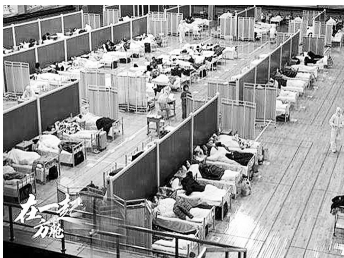
一比一还原方舱医院