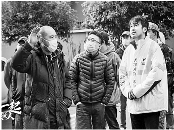
雷佳音饰演快递小哥