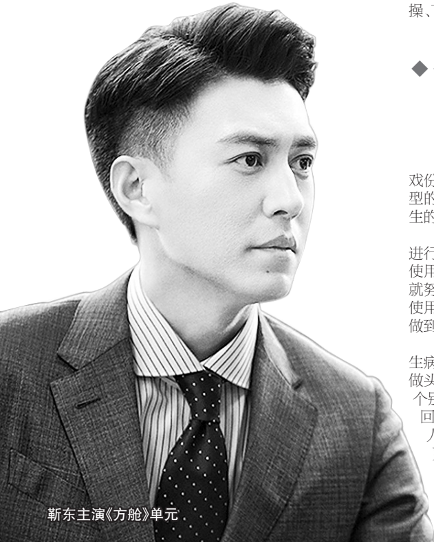
靳东主演《方舱》单元

研究人员连续8天询问参与者的每日活动，并对多样性进行评分；10年后，他们追问了相同的问题，并通过“简易成年人认知功能测试”对参与者多个维度的认知功能进行了考察，包括工作记忆广度、语言流畅性、注意力、推理和语言记忆能力。分析结果显示，这10年中，活动更多样的人比活动多样性低的人表现出更高的认知功能。研究人员认为，从成年早期开始参与多项活动有助于维持若干年后的认知功能。但对于大多数成年人，这段时期十分繁忙，活动多样性可能并不高。据新华社