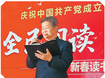
老年记者讲述读书心得