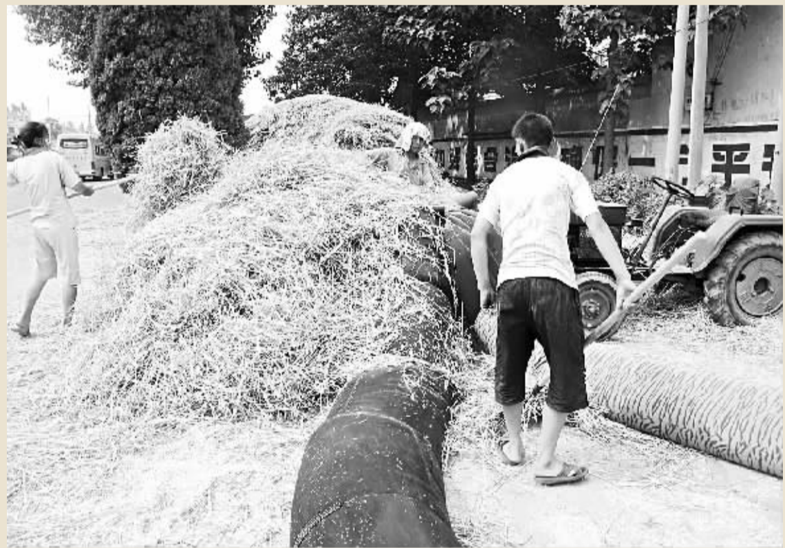
6月20日,村民正在家门口加工草料。宁陵县柳河镇赵庄村是少数民族村。近年来,当地回族群众大力发展传统养殖业,纷纷将小麦秸秆进行加工、贮藏。

至此,梁园区“2011·4·23”杀人抛尸案胜利告破。目前,此案正在进一步审理中。