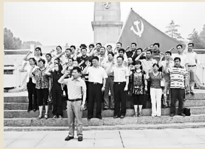
6月18日,市运管处全体党员干部参观了陈官庄淮海战役纪念馆并重温入党誓词。大家表示,通过此次活动,学习了革命先烈的坚定理想信念,进一步认识了政治坚定、思想常新、理想永存和永葆共产党员本色的重要性。