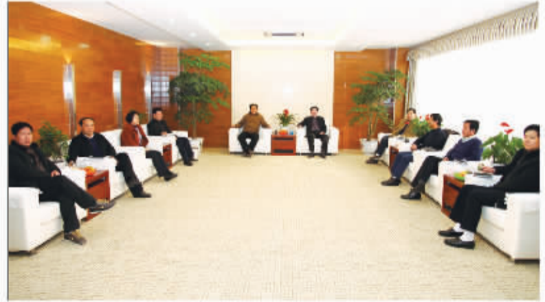
商丘市国土资源局党组部署耕地保护工作。