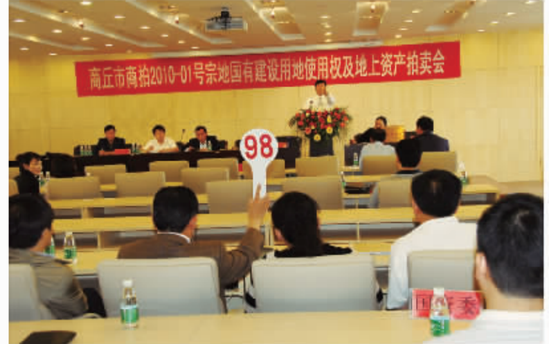
国有建设用地拍卖会现场。