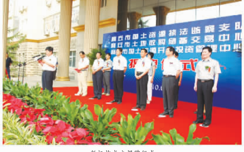
新机构成立揭牌仪式。