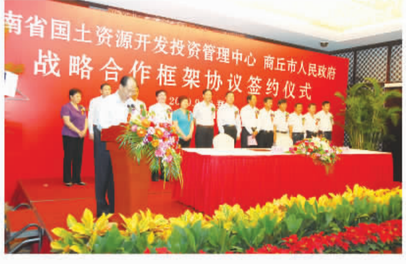
战略合作框架协议签约仪式。