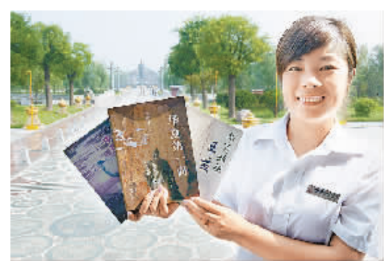
△景区工作人员展示部分介绍华商始祖的书籍。