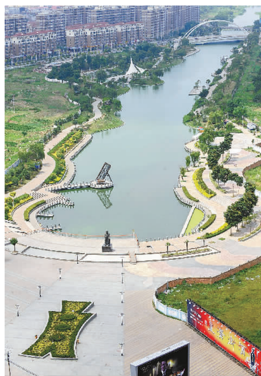
△商都广场始建于二〇〇五年十月，面积一万三千平方米，主广场由五颗六色的大理石和将玉石碎文又铺满，被世人誉为“华商之都”的壮观景象。在王亥巨型铜像前方是九座古钱币灯饰，古钱币花坛和十九枚玉石盘石窗，寓意着千年商都的兴旺繁荣。