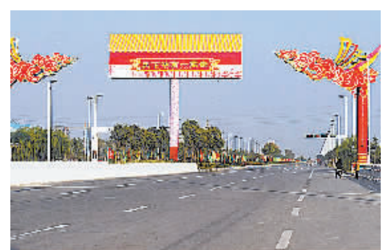
△华商大道，红线宽度为110至120米，双向八车道。华商大道园林绿化景观由北京林业大学设计，绿化建设面积达50万平方米，整个工程已于2010年5月全部建成。今年5月，华商大道荣获河南省“十佳城市道路”称号。