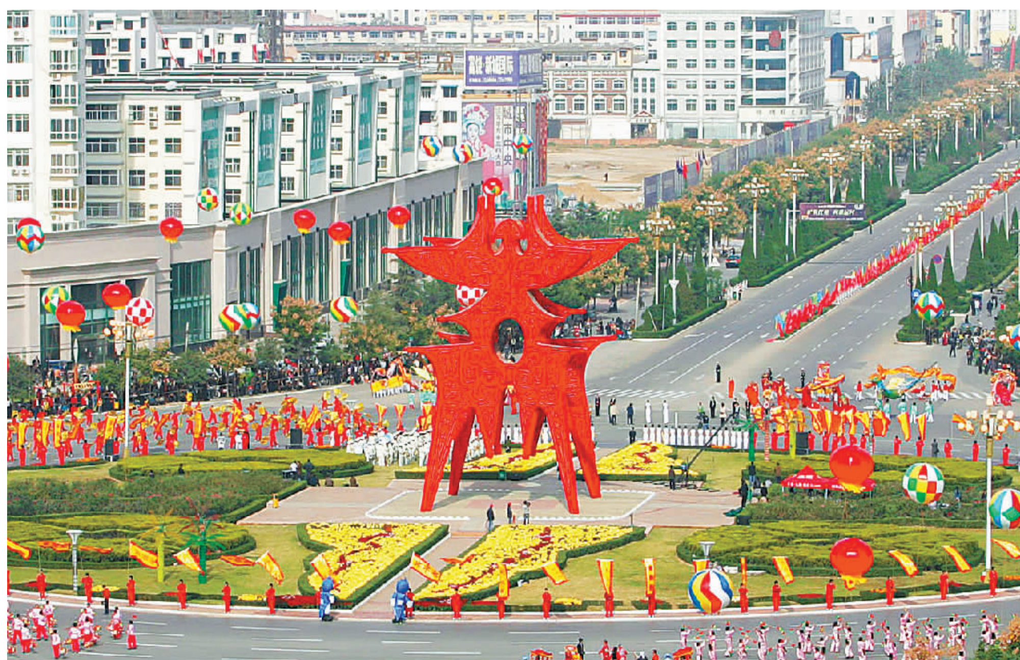
△“商”字雕塑高二十米，横向跨度二十二米，屹立在两千五百平方米的环岛，是商丘的城市标志。这座雕塑是根据甲骨文“商”字造型进行设计并取舍和夸张，由两个垂直交叉的“商”字呈鼎足形设计而成。从前后左右的四个方位看都是相同的，气势磅礴，既体现了东方文化的底蕴，又寓意商族在这里起源、商业从这里开始、先商民族在这里繁荣昌盛。