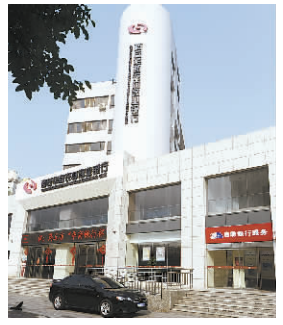
△以华商冠名的商丘华商农村商业银行。