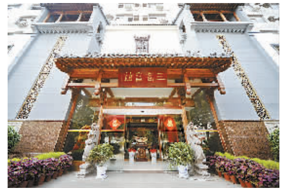
△以“三商”命名的三商会馆酒店。

商丘农产品中心批发市场形成的农产品价格，每天在央视财经频道滚动播出，已成为国家权威农产品信息的“商丘价格”，成为全国农产品市场价格的重要风向标，成为商丘在全国叫得响的一个标志。 “商丘价格”的形成与商丘农产品中心批发市场在全国的地位密不可分。从2006年至今，市场交易额已连续多年突破百亿元大关。目前，该市场先后被国家有关部门评定为“农业产业化国家重点龙头企业”、“农业部第一批重点联系市场”、“农业部信息采集点”、“全国农产品综合批发十强市场”、“全国农产品经营管理创新双十佳市场”。