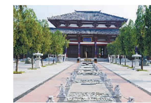
△商祖殿，又名王亥殿，仿汉建筑，高十六米，深十六米，面阔七间。