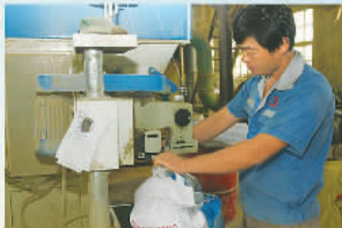
机械化生产流水线作业