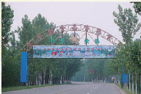
和昌集团旗下的清河源食品有限公司一角