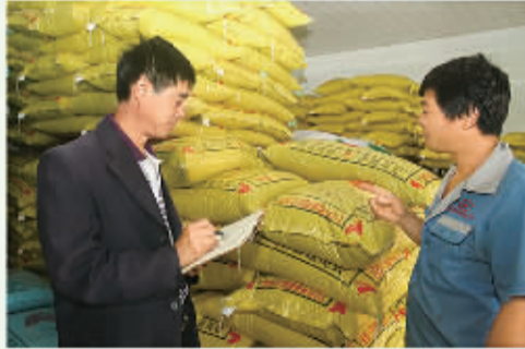
仓库保管人员在认真核实出库数量