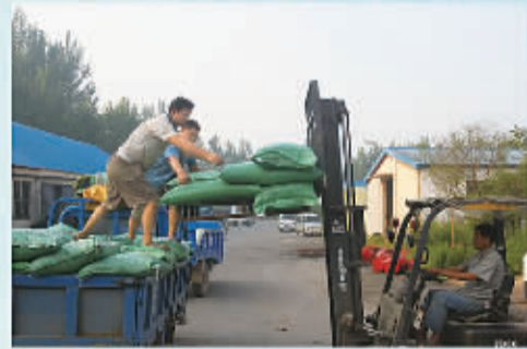
供不应求的和昌系列饲料外运到各地水产养殖户