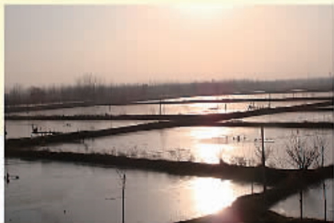
和昌集团旗下的无公害养殖基地迷人夜景