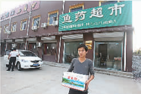
和昌集团旗下的鱼药超市服务于广大养殖户