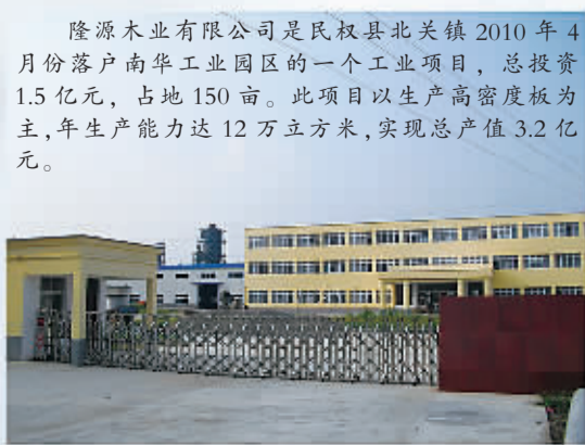
隆源木业有限公司是民权县北关镇2010年4月份落户南华工业园区的一个工业项目，总投资1.5亿元，占地150亩。此项目以生产高密度板为主，年生产能力达12万立方米，实现总产值3.2亿元。