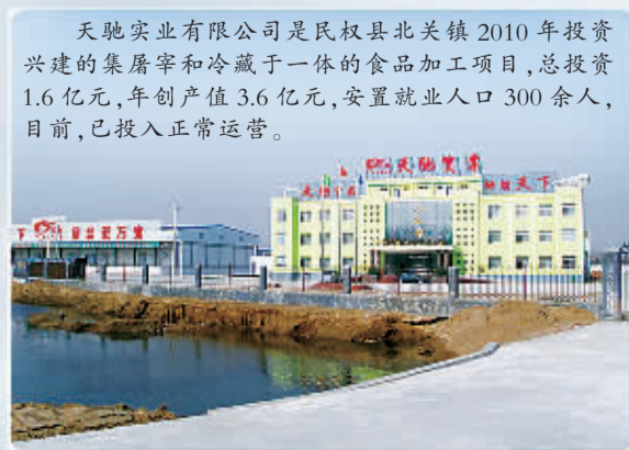
天驰实业有限公司是民权县北关镇2010年投资兴建的集屠宰和冷藏于一体的食品加工项目，总投资1.6亿元，年创产值3.6亿元，安置就业人口300余人，目前，已投入正常运营。

北关，这片神奇的热土，到处充满着生机，到处孕育着希望，我们相信，在不久的将来，北关镇将成为一颗镶嵌在中原大地上的璀璨明珠，熠熠生辉，耀眼夺目。