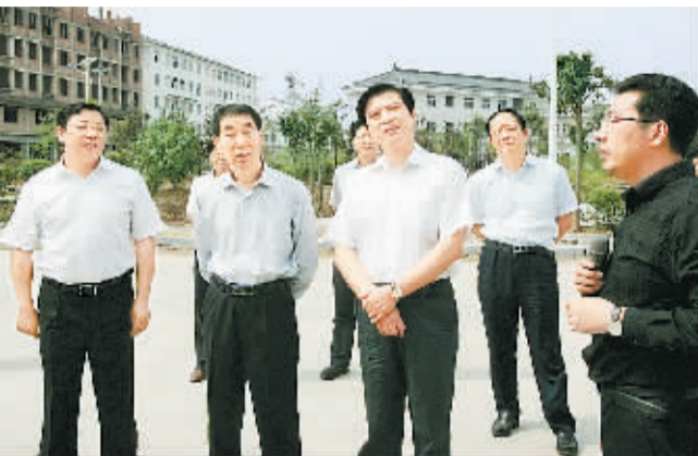
9月20日,副省长王铁在市委书记陶明伦的陪同下在永城市芒山镇雨亭社区调研。

中共商丘市委机关报 商丘日报报业集团出版 党报热线:2617983 新闻热线:2614648 评报热线:2613749 广告热线:2624468 发行热线:2615105