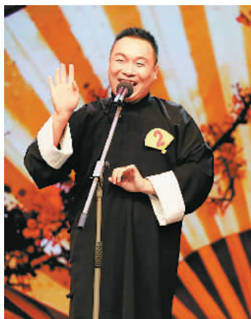
魏鹏在第六届央视相声大赛演出中。(资料照片)

2011年11月21日，魏鹏和其他四位师兄弟正式拜著名影视、曲艺表演艺术家侯耀华为