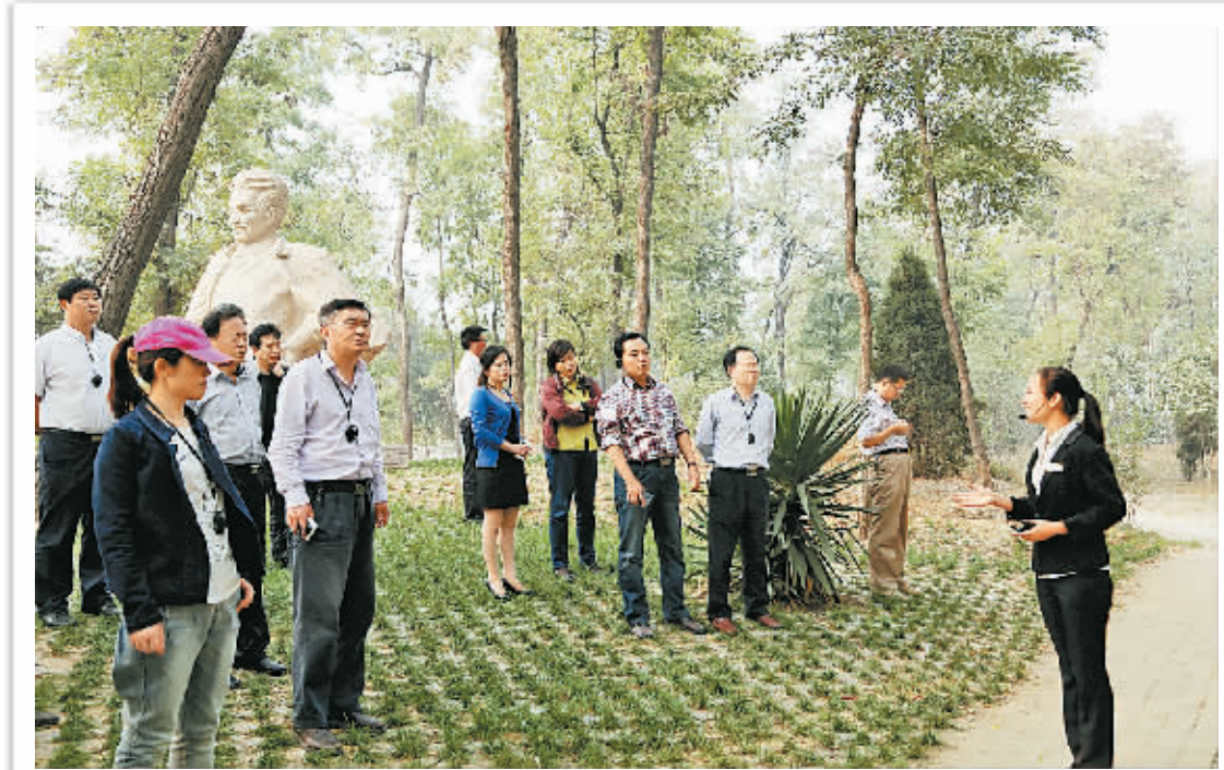
10月9日,市委党校第五期县处级干部培训班学员到开封市兰考县参观焦裕禄烈士事迹展览馆,在烈士墓前重温入党誓词。图为学员们在焦裕禄当年治沙、治水的下马台实地考察。