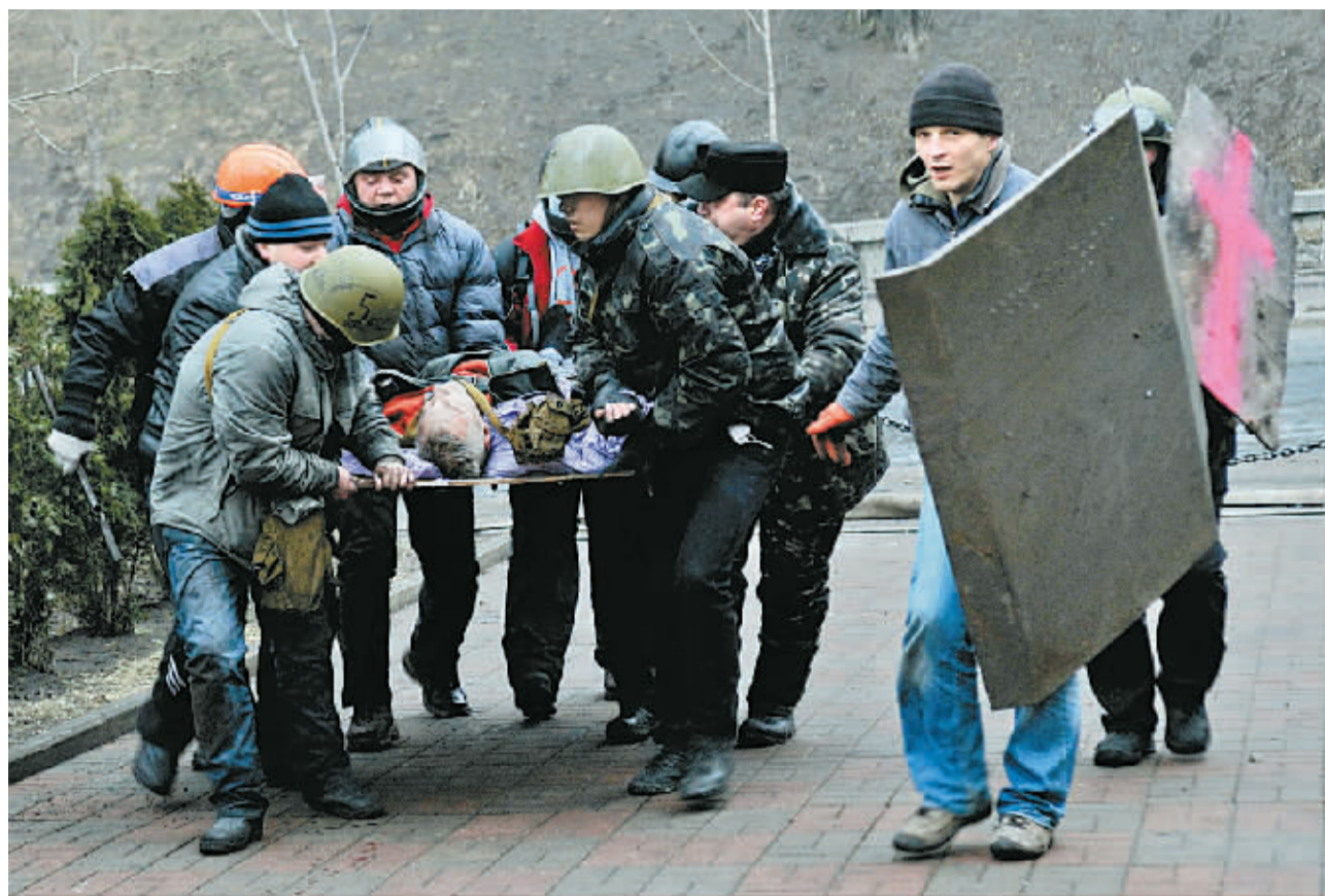
2月20日，在乌克兰首都基辅，示威者运送伤员。

德国总理默克尔20日与亚努科维奇通电话。默克尔的发言人说，默克尔告诉亚努科维奇，“主要的责任在于乌克兰政府”，只有通过对话，就组成新政府和修改宪法取得“快速、有实质的