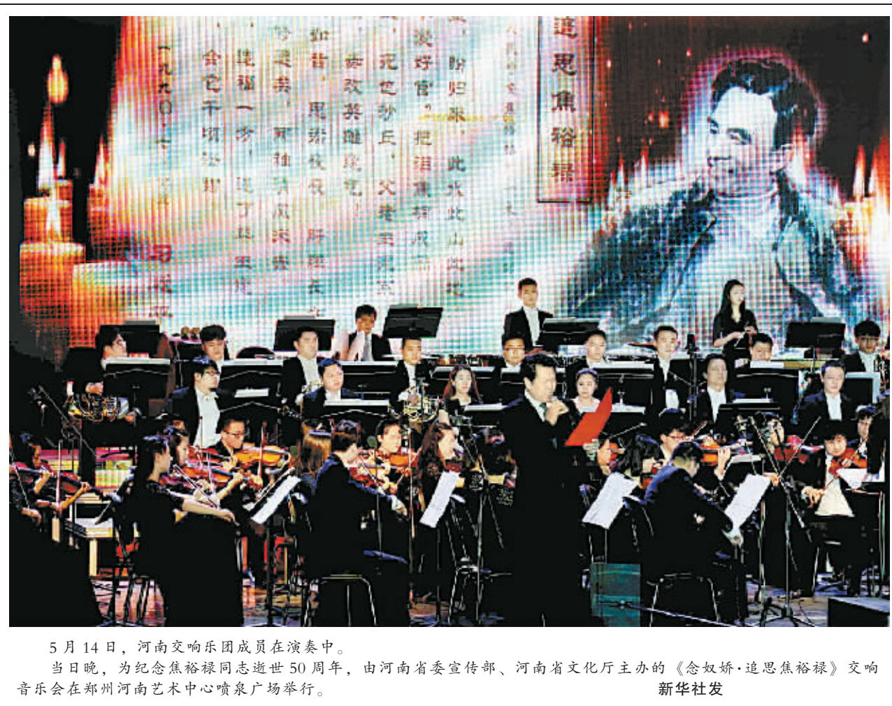
5月14日,河南交响乐团成员在演奏中。