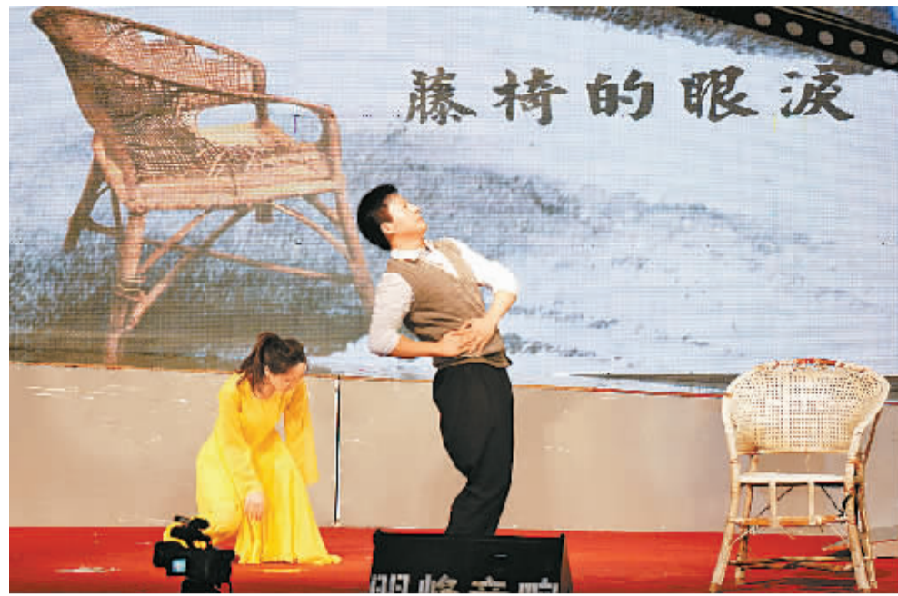
7月2日晚,根据我市青年女作家欧阳华的长篇叙事诗《焦裕禄——把泪焦桐成雨》改编的大型音诗画舞台剧《焦裕禄》在商丘师院礼堂预演。

我市迅速集中了一批优秀作家、导演、编舞、音乐等主创人员,根据这首长诗改编排练大型音诗画舞台剧《焦裕禄》。7月2日,大型音诗画舞台剧《焦裕禄》在商丘师院礼堂预演。该剧利用声光电巧妙组合的现代艺术手法,把观众带入焦裕禄在兰考走过的激情燃烧的岁月,生动地诠释了焦裕禄精神的