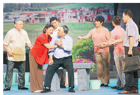
8月18日，演员在河南省许昌市许都大剧院表演大型现代豫剧《燕振昌》。该剧根据河南省长葛市胡集镇水磨河村原党委书记燕振昌生前事迹创作，展现燕振昌身为基层干部的价值追求和使命担当。