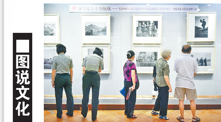
8月20日，纪念中国人民抗日战争暨世界反法西斯战争胜利70周年广州摄影家珍贵历史图片展——“沙飞镜头中的抗战”在广州农民运动讲习所旧址纪念馆开幕。此次展览精选百余幅沙飞的战地摄影作品。

陈福民说，新世纪以来，面对大众化和网络化文化的冲击，纯文学的市场空间和读者数量呈现递减趋势。“很多人在唱衰纯文学，但是通过这次茅奖评选，我们可以看到一个事实，文学内部秩序在起作用，纯文学的写作和阅读一直在进行，并拥有坚强的读者群。”(新华社北京8月19日专电)