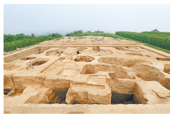
这是8月11日在河南省洛阳市孟津县新庄村拍摄的一东汉大型烧窑遗址考古现场。河南省洛阳市文物考古研究院的考古人员推测这里是一处大型东汉官窑遗址。