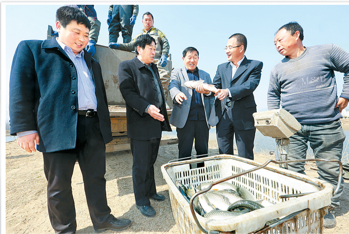
3月20日,民权县农信社工作人员走访显锋水产养殖场,了解贷款户需求。该联社坚持服务“三农”和经济发展,做好支农支小支微文章,积极把握信贷投向,取得了明显成效。

说起中国农业银行,我脑海中就不由自主地浮现出以往和农行打交道的故事。 几年前,我的父母从老家来到城市打拼。起初,父亲想买一辆车准备在市里开出租车,然而积蓄微薄,买车的钱还差一部分,这令全家人十分忧愁。难道在外工作真的没有一点希望吗?一天,一个叔叔来到家里告诉父亲,可以到中国农业银行贷款,以解燃眉之急。就这样,事情终于有了转机,在农业银行工作人员的指导和帮助下,没多久,父亲成功申请到了农业银行的贷款,当一名出租车司机的愿望也得以实现。我们全家人都很开心,也更加感谢农业银行为我们提供的这项服务。 农业银行为人们的生活提供了很多便捷。平时,农行的工作人员经常到各个乡镇、村庄,上门为老百姓办卡,他们对工作无不尽职尽责。得益于他们的热情服务,村民们省去了去市区或镇上办卡而经历的路途奔波。除了不辞辛劳到乡下帮助老百姓办卡外,他们也经常到高校里为学生提供办卡等咨询服务。记得有一次在学校,下着雨,我看到穿着制服的农行工作人员在校园搭了一个简易的棚子,在雨中继续工作着,看着他们风雨无阻不停忙碌的身影,我心生感动。以前在老家经常看到他们热情服务的身影,如今在学校也能偶尔见到他们,觉得很亲切。 我有一个叔叔在农业银行上班,今年寒假,我帮助叔叔在农网上行处理理财业务,做一些基金定投或购买基金,这是一件需要耐心和认真的工作,也是一件有趣的工作。那段时间,我学到了不少金融知识。经过那次实践锻炼后,我更加感受到农业银行线上、线下工作的完善和相得益彰。农行的各个营业网点在线下为客户服务,环境温馨,服务快捷。同时,通过农业银行的电子银行,人们也可以自行办理理财。 回想和农行相处的那些日子,无论是农业银行为我们带来的便利,还是工作人员贴心服务的身影,都让我倍感温暖。