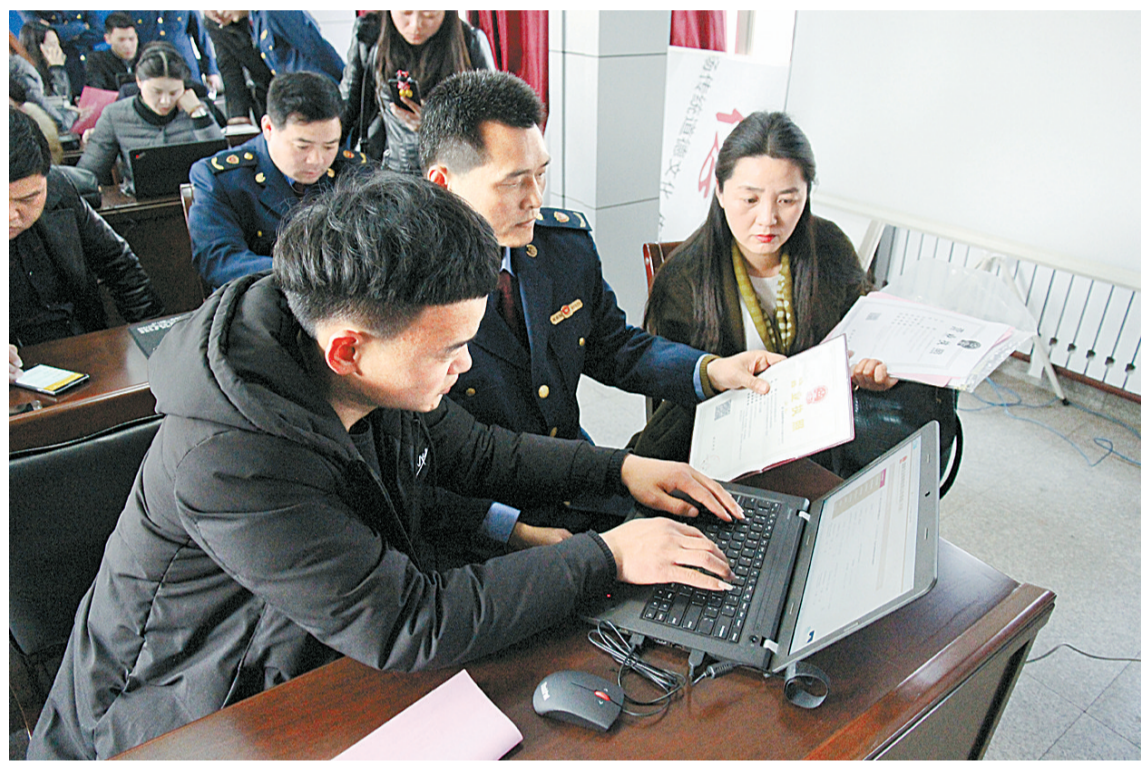
3月20日,工商人员手把手帮助企业进行年报公示。为切实做好2016年度市场主体年报公示工作,市工商局专业分局创新开展“集中服务月”活动,并把今年3月份作为集中服务企业年报活动月。

以案件回访促进法制宣传。利用回访契机,对当事人加强法制宣传教育,采取“说、劝、引、帮”等柔性措施,向案件当事人宣讲与其生产经营相关的法律法规,引导当事人学法、知法、懂法,增强其法律意识,促进当事人规范行为、合法经营。